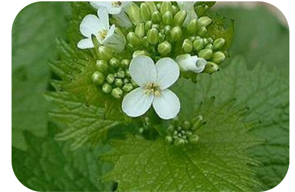
Alliaria ( Alliaria petiolata ) – Foglie e giovani getti per minestre