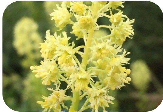
Amorino giallo ( Reseda lutea ) – Foglie in insalata