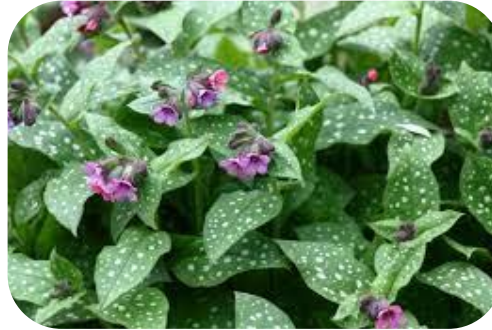
Polmonaria ( Pulmonaria officinalis ) – Foglie in minestre e infuse